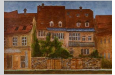
「古都の町並み」田中 章夫